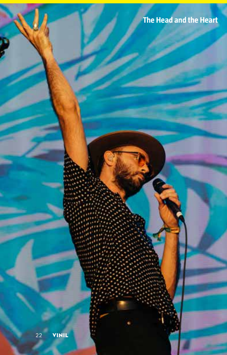
The Head and the Heart