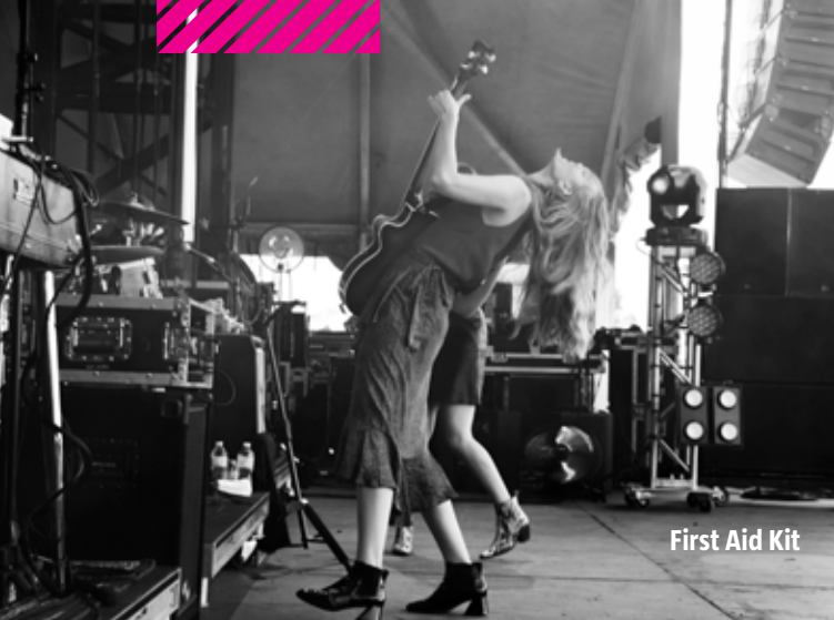
First Aid Kit