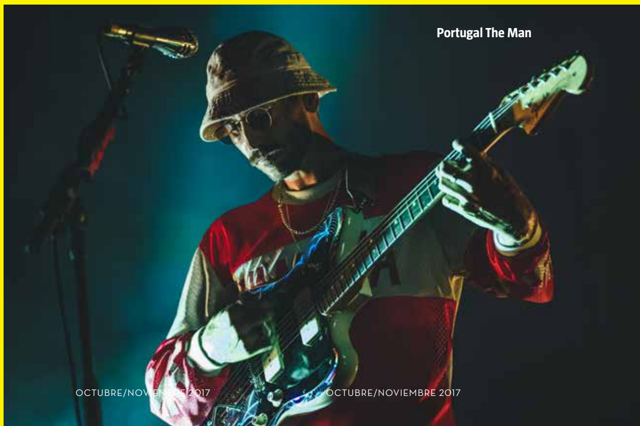
Portugal The Man