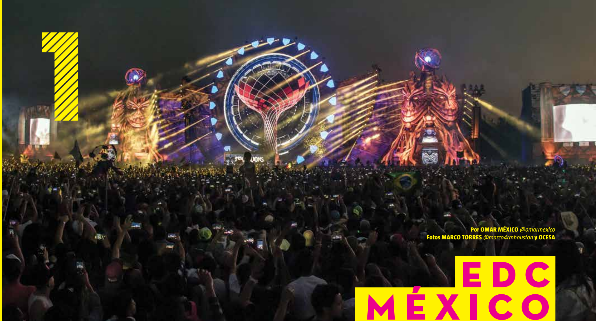
Por OMAR MÉXICO @omarmexico

Sin importar la edad, los asistentes del EDC disfrutaron del evento durante sus dos días en el autódromo. La edición 2017 terminó el domingo con las presentaciones de Marshmellow , Alan Walker y los ganadores del Grammy , The Chanismokers quienes pusieron a brincar a los más de 100 mil asistentes en el lugar.