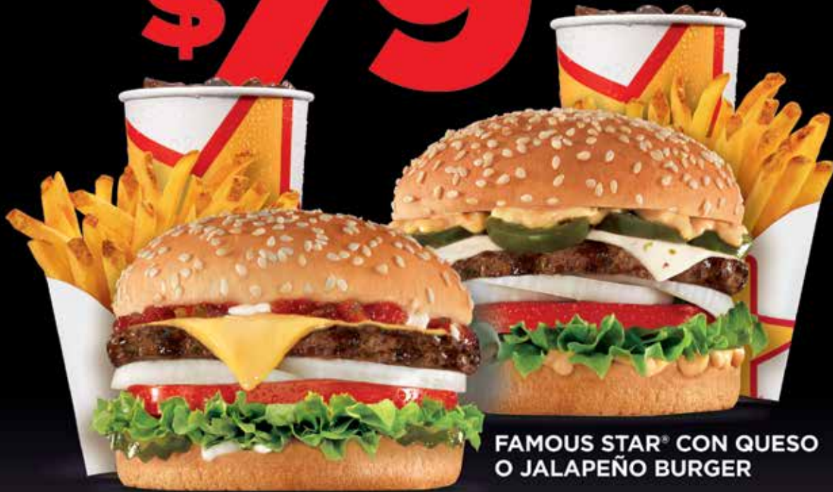
FAMOUS STAR® CON QUESO O JALAPEÑO BURGER

LOS COMBOS INCLUYEN PAPAS CHICAS (105 GR) Y REFRESCO CHICO (590 ML). VIGENCIA DEL 1 DE ABRIL AL 30 DE JUNIO DE 2017. NO VÁLIDO CON OTRAS PROMOCIONES U OFERTAS.